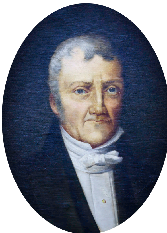
Fotografía de Eugenio Autran (arriba) y retrato de Aimé Bonpland (abajo) que se encuentran en el Museo de Farmacobotánica "Juan A. Domínguez".